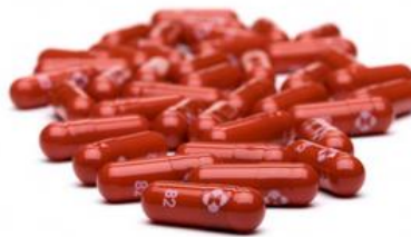
ยาโมลนูพิราเวียร์

เว็บไซต์ : https://www.hfocus.org/content/๒๐๒๒/๐๓/๒๕๗๔๙